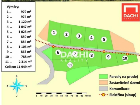
Pozemek 5 1 025 m 2