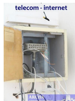
telecom - internet