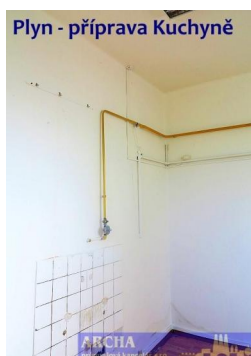
Plyn - příprava Kuchyně